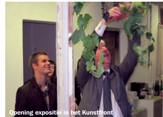
Opening expositie in het Kunstfront