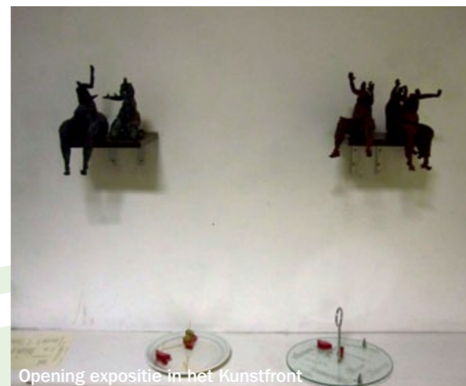
Opening expositie in het Kunstfront