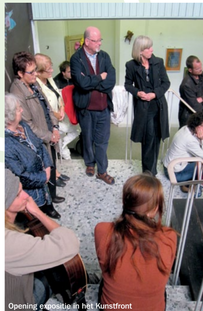
Opening expositie in het Kunstfront