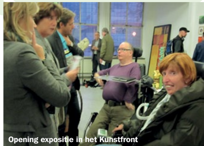
Opening expositie in het Kunstfront