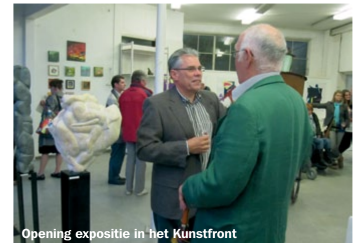
Opening expositie in het Kunstfront

“Jeder Mensch ist Künstler” (Joseph Beuys)