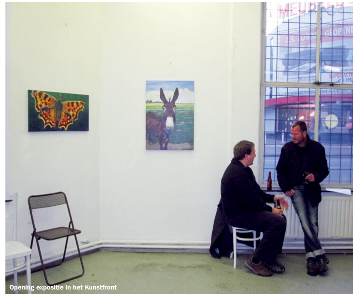
Opening expositie in het Kunstfront