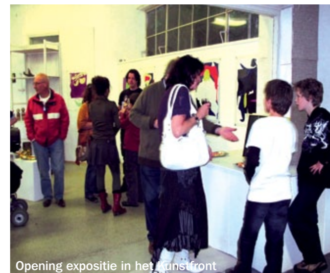
Opening expositie in het Kunstfront